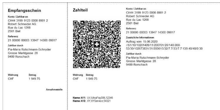
QR-Rechnung mit QR-Referenz und QR-IBAN (ersetzt den orangenen Einzahlungsschein)