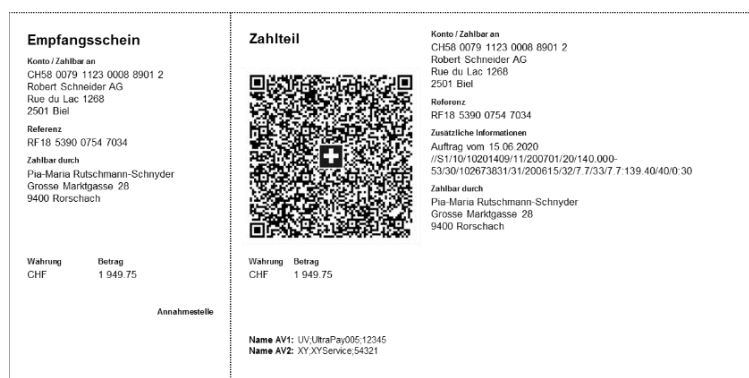
QR-Rechnung mit Creditor Reference und IBAN (neue Nutzungsmöglichkeit)

Die QR-Referenz entspricht der heutigen ESR-Referenz und dient dem einfachen Abgleich von Rechnungen mit Zahlungen beim Rechnungssteller. Bestehende ESR-Referenznummern können weiterhin verwendet werden, wodurch der nahtlose Übergang von der ESR zur QR-Rechnung möglich ist. Die QR-Referenz darf nur mit der so genannten QR-IBAN genutzt werden. Die QR-IBAN ist im E-Banking unter Finanzen – Kontoauszug – Kontoinformationen (Ende April 2020) ersichtlich. Ansonsten dürfen Sie sich auch gerne bei Ihrem/Ihrer Kundenberater/in melden.